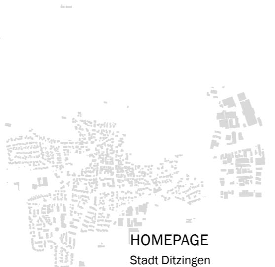
HOMEPAGE Stadt Ditzingen